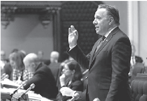
Dans une pose caractéristique à la Donald Trump, le "Cheuf" Legault explique aux partis de l'opposition que lui, il n'aime pas beaucoup ça, l'opposition, et qu'il est inutile qu'ils s'opposent.

Dans ce dernier cas, le ministre responsable a déposé en pleine nuit à la dernière minute, pratiquement juste avant le vote final, d'importants amendements à sa propre loi, lesquels avaient été manifestement préparés à l'avance, dans le but évident