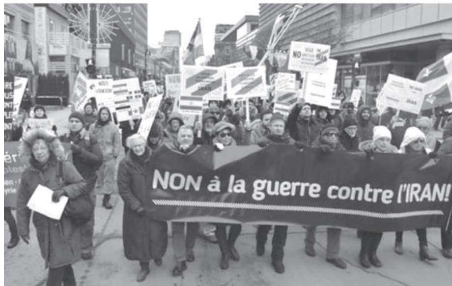
Le 25 janvier dernier, comme dans plusieurs villes à travers le Canada et à travers le monde, plusieurs centaines de personnes ont manifesté à Montréal leur opposition aux actes de guerre menées par les États-Unis contre l'Irak et qui menacent la paix mondiale.

L'impérialisme américain prospère grâce aux agressions, aux tensions et aux guerres qu'il mène dans la région et dans le monde, tandis qu'il cherche à renforcer sa domination sur la souveraineté des États, des nations et des peuples qu'il subjugué, à l'encontre de ses rivaux impérialistes.