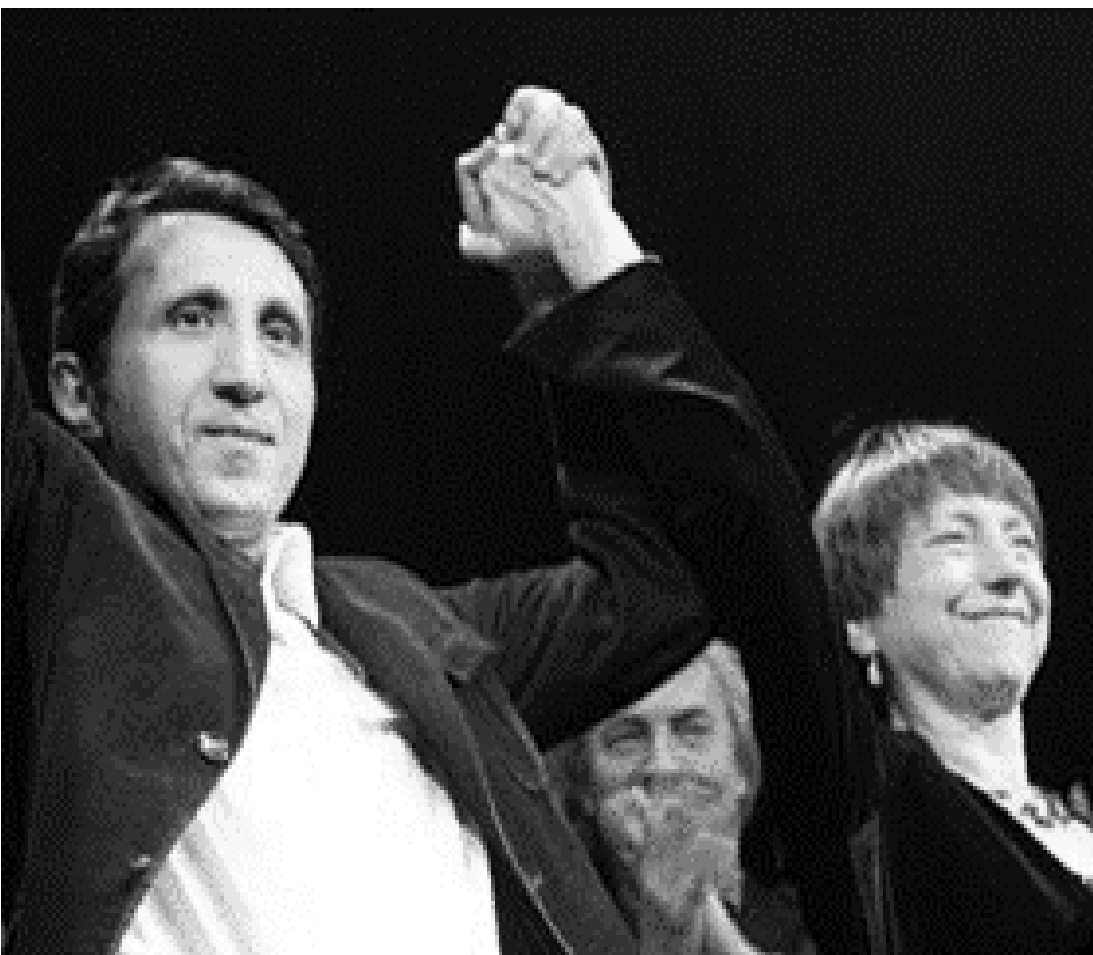
Amir Khadir et Françoise David, lors de la soirée électorale de Québec Solidaire au Medley, à Montréal, le 8 décembre 2008.

Considérant ses faibles moyens, QS a concentré le gros de ses énergies dans les comtés de Montréal où ses deux portes-parole étaient candidats. Cette tactique a réussi en grande partie puisque Françoise David est arrivée en bonne deuxième position dans les grands médias lui Gouin et Amir Khadir fut élu dans ont accordé, Québec Mercier. Son élection va donner à QS une tribune et une crédibilité qui devrait lui servir dans le futur. ■ Amir Khadir et Françoise David, lors de la soirée électorale de Québec Solidaire au Medley, à Montréal, le 8 décembre 2008.