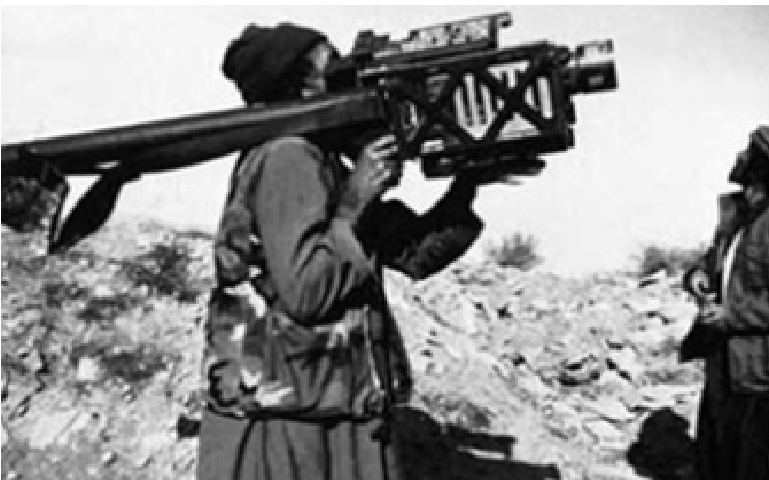
Un Mujahidin pointant un missile Stinger fabriqué aux États-Unis près de Gardez, Afghanistan, Dec. 1991.

En Afghanistan même, à partir de 1995, une branche extrémiste de l'Islam sunnite, « les talibans », abondamment financée et conseillée par l'ISI et par la CIA avec le soutien des partis politiques islamiques pakistanais, se fraya un chemin vers le pouvoir,