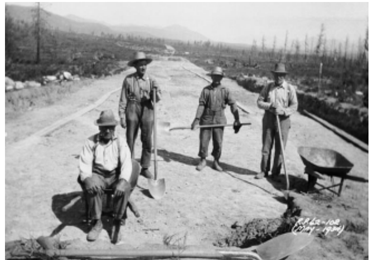
Projet de construction de route pendant les années 30

En rejetant la demande du mouvement ouvrier d'améliorer l'accès et le niveau des prestations d'assurance-emploi, le Premier ministre Harper prend la même position que "Iron Heel" Bennett il y a plus de soixante-dix ans. Comme toujours, le Parti conservateur se tient avec les patrons, qui utilisent la faim et la pauvreté comme un fouet pour frapper la classe ouvrière afin de la soumettre durant une époque de crise économique. Nous avons besoin de lutter en mobilisant à nouveau un puissant mouvement de masse, en exigeant des emplois et des revenus suffisants pour tous, y compris l'assurance-emploi à 90% du salaire antérieur pendant toute la durée du chômage. ■