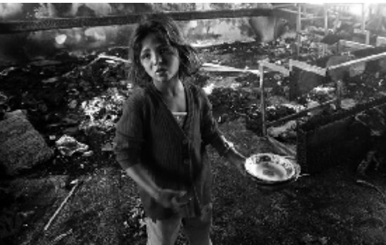
L'intérieur de l'école après le bombardement

L'agression sauvage et criminelle d'Israël à Gaza, qui a commencé le 26 décembre 2008, est en train d'infliger à la population d'atroces souffrances. Jusqu'ici plus de 800 Palestiniennes/iens, pour la plupart des civils, ont été massacrés et des milliers d'autres ont été blessés ou mutilés. Le bombardement constant de la ville de Gaza et d'autres localités a engendré une catastrophe humaine aux proportions alarmantes. L'agression israélienne n'est rien d'autre qu'un crime contre l'humanité.