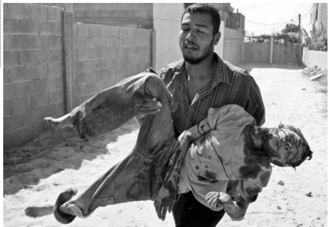
Victime de l'agression d'Israël sur la bande de Gaza

Ces résultats sont les meilleurs depuis l'accord de paix que le FMLN a signé en 1992. L'accord a mis fin à une longue guerre civile pendant laquelle les militaires et les forces de droite, soutenus par les Etats-Unis ont perpétré de nombreux massacres contre les paysans, les syndicats, et divers représentants de l'opposition.■