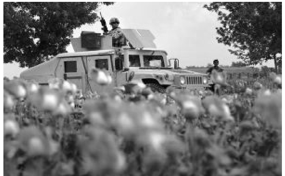
Un véhicule humvee de l'armée américaine passe à côté d'un champ de pavot destiné à la production d'opium, près de Lashkar Gah, dans la province de Helmand en Afghanistan

Les derniers ouvrages de Michael Parenti sont : « The Michael Parenti reader » et « God and his demons », à paraître. Pour de plus amples renseignements, consulter le site www.michaelparenti.org ■